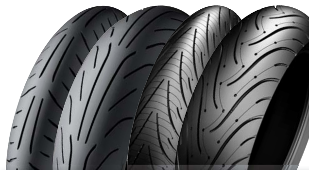
MICHELIN Power Pure

Dimension (bitte ausfüllen) MICHELIN Reifen (bitte ankreuzen) VR ..... MICHELIN POWER ONE Ihre Bemerkung: MICHELIN POWER PURE ..... MICHELIN PILOT POWER 2CT ..... MICHELIN PILOT POWER ..... MICHELIN PILOT ROAD 3 ..... MICHELIN PILOT ROAD 2 ..... MICHELIN PILOT ROAD ..... MICHELIN ANAKEE 2